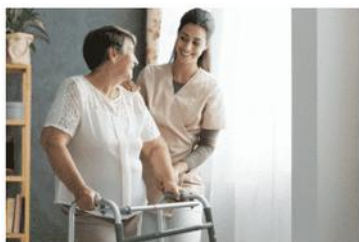
La nouvelle identité pour le Refuge des cheminots !

Un questionnaire adhérents réalisé récemment montre que le principal problème est l'isolement. Dans ce cadre les bénévoles mènent, notamment, des initiations à l'informatique pour aider les personnes âgées à engager des démarches simples.