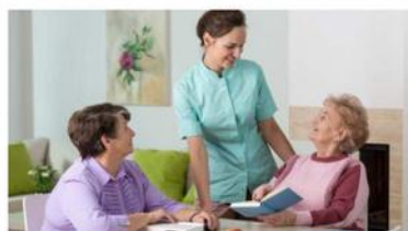
Un nouvel axe de développement

- Mention sur le site de chaque Association de l'existence de l'autre avec lien vers son site ;