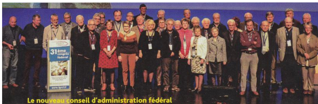
Le nouveau conseil d'administration fédéral

Un vif intérêt des participants s'est manifesté avec quelques échanges sur le bénévolat, concrétisé quelques jours plus tard , un Président de section a souhaité notre intervention sur sa section de Brest en début 2020.